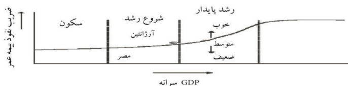
شکل ۲- ضریب نفوذ بیمه عمر

در مرحله بلوغ بازار بیمه، رشد آهسته مجدداً بر بازار بیمه حکفرما می شود و ممکن است حتی با یک وقفه نسبت به رشد اقتصادی اتفاق بیفتد. بازار بیمه به کشف ریسکهای جدید و ارائه راه حل های جدید برای پوشش آنها می پردازد، اما منافع آن نسبت به مرحله قبل رشد و توسعه بازار بیمه کمتر است. همانطور که ملاحظه شد قدرت پیوند بین بخش بیمه و رشد اقتصادی ایستا نیست در حالی که ارتباط بین بانک، بازار سرمایه و رشد اقتصادی با سطح توسعه اقتصادی تغییر می کند، رابطه بین بیمه و رشد اقتصادی نیز تغییر می کند. بخش بیمه در کشورهای توسعه یافته مجموعه کاملی از محصولات و خدمات تخصصی شده و کلان آموزش دیده و باتجربه را ارائه می دهد و پوشش بیمه به عنوان یک ارزش مهم شناسایی می شود. به نظر می رسد که درآمد یا تولید ناخالص داخلی یک سرمایه معنادارترین تأثیر را با پیروی از نرخ بهره و تورم بر مصرف بیمه دارد. اهمیت قیمت بیمه برای تقاضای بیمه مبهم است، اما مطالعات بسیاری بیمه را یک کالای لوکس (با اشاره به کشش درآمدی بیشتر از واحد) یافته اند. (USAID, 2006)